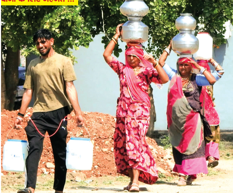
गंजबासोदा। ऊंट और भेड़ लेकर नगर में आए राजस्थानी चरवाहों ने अपने डेरे शहर के पास लगाए हुए हैं। चरवाहा परिवार की महिलाओं और बच्चों को पानी लाने के लिए पं मेहनत करनी पड़ रही है।