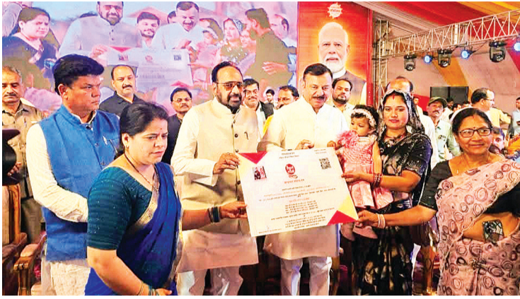
परिवहन सेवा की शुरुआत होगी, जो धीरे-धीरे पूरे प्रदेश में लागू होगी।

स्कूल शिक्षा एवं परिवहन मंत्री उदय प्रताप सिंह ने कहा कि मध्य प्रदेश में मुख्यमंत्री डॉ. मोहन यादव के नेतृत्व में लगातार विकास कार्य किए जा रहे हैं। इसी परिप्रेक्ष्य में स्कूल शिक्षा विभाग द्वारा आने वाले समय में 200 नए सांदीपनि विद्यालय शुरू किए जाएंगे, जिसमें 20 करोड़ की लागत से रहली विधानसभा क्षेत्र के रहली-शाहपुर में यह विद्यालय शुरू होगा। उन्होंने कहा कि इसी प्रकार परिवहन प्रदेश के विकास के लिए 24 घंटे कार्य कर रहे हैं। उन्होंने कहा कि इसी