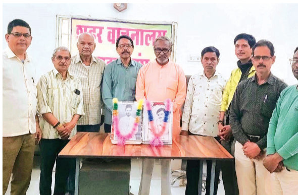
हरिभूमि न्यूज | गंजबासोदा