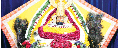
हरिभूमि न्यूज विदिशा